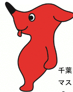
千葉県 マスコットキャラクター 「チーバくん」