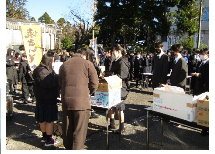
「健康フェスティバル」での出張相談会 越智町のいきいきセンターにて