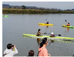
<パラカヌー体験会>